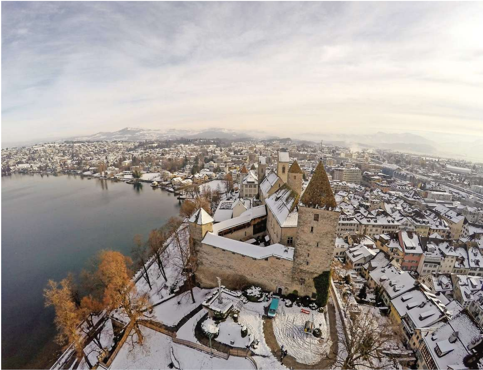
Wie Tauben das Schloss Rapperswil sehen: Aus 60 Metern Höhe schiesst die Minikamera der Drohne erstaunlich scharfe Bilder.